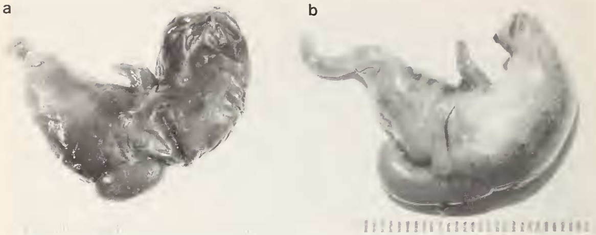
Abb. 3: Vergleich der Magendrüse von Lophuromys flavopunctatus (a) und L. woosnami (b), Vertreter der Untergattung Lophuromys , deren Drüsenkomplex relativ kurz-paketförmig ist bzw. der Untergattung Kivumys , die lang-wurstförmige Drüsen hat.